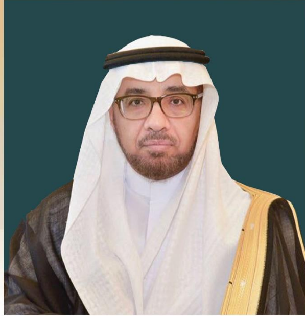
معالي رئيس جامعة الملك فيصل الدكتور / محمد بن عبد العزيز العوهلي