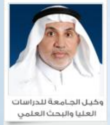
وكيل الجامعة للدراسات العليا والبحث العلمي