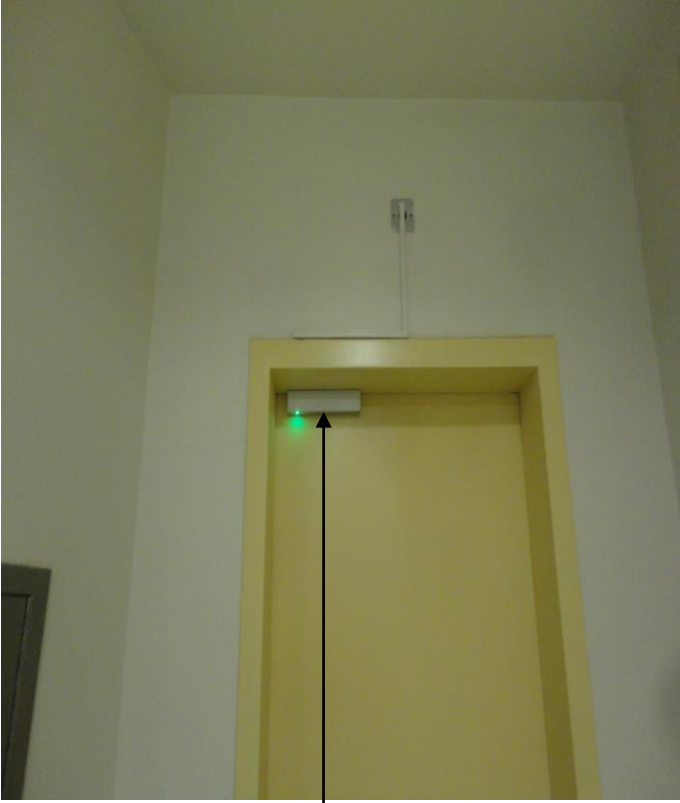
القفل المغناطيسي لأبواب الطوارئ