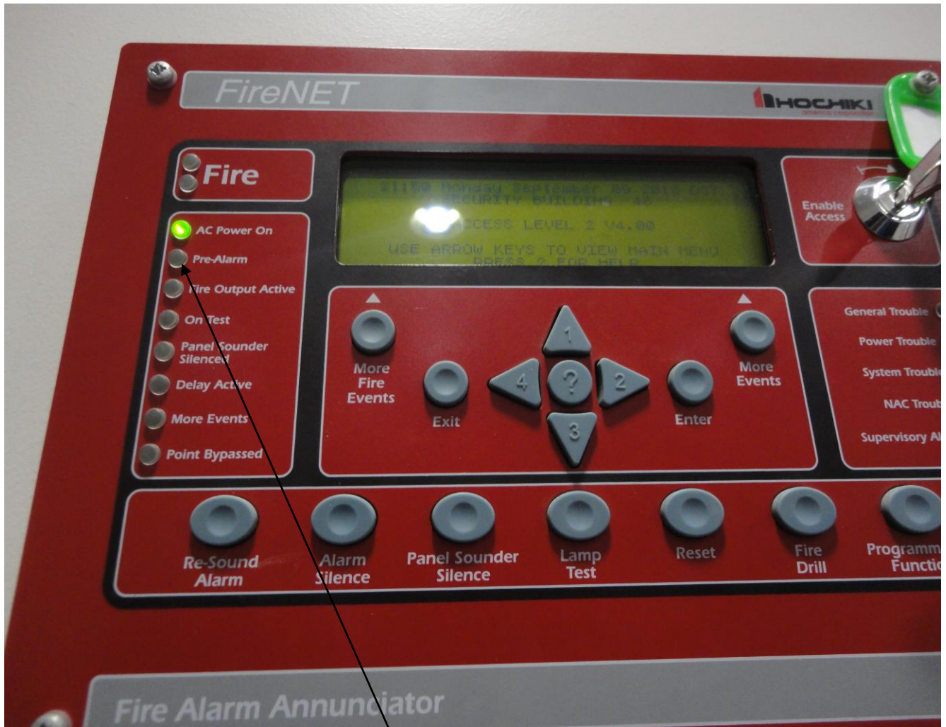
لمبة انذار الحريق (Fire Alarm)

٢- يتم الضغط على زر اسكات الاجراس ثم الضغط على زر اعادة النظام الى الوضع الطبيعي